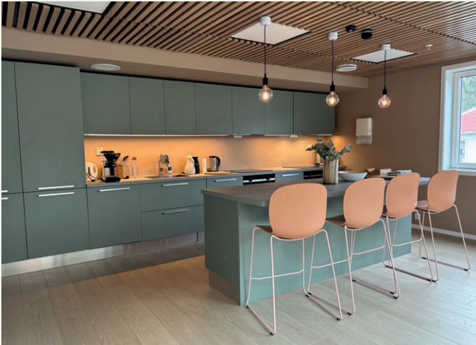
Felleskjøkkenet er tilknyttet mesaninen.