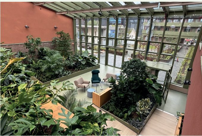
En helårlig vinterhage er kjennemerket i Signaturhagens prosjekter, i Stjørdal i form av en glassgård over to og halv etasje. Hagen vedlikeholdes av profesjonell gartner.