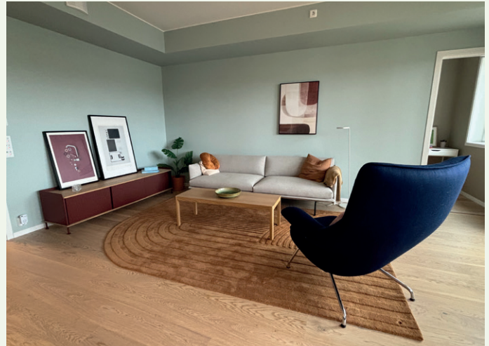
Stua i en 74 kvadratmeter stor leilighet.