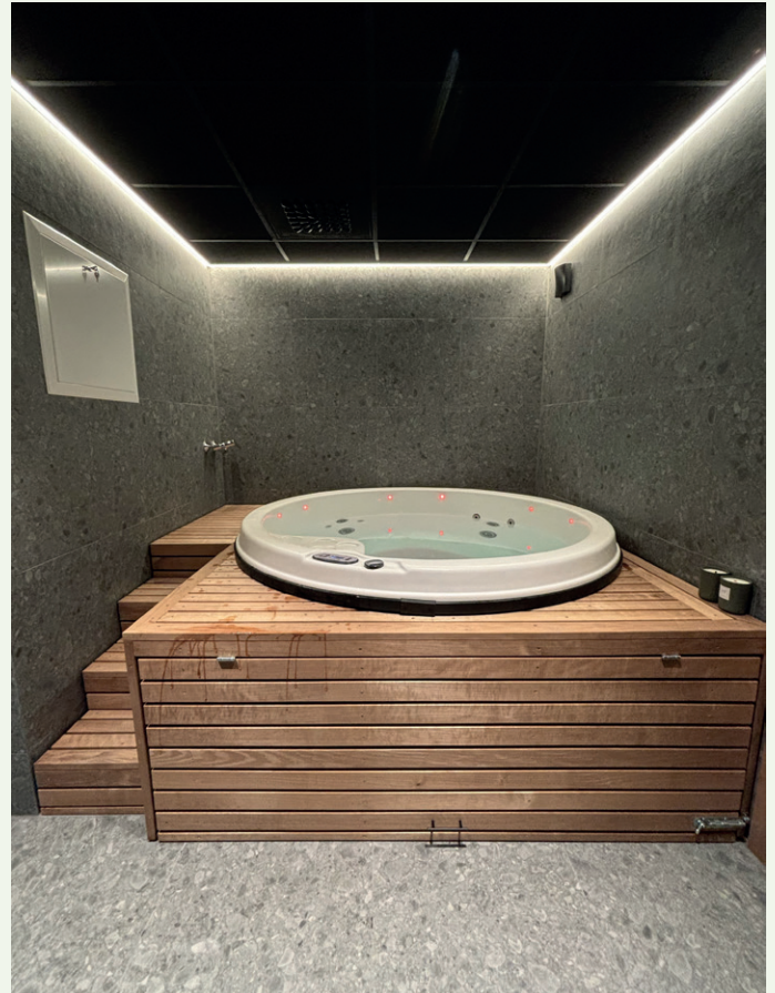
Boblebad i fellesområdet.