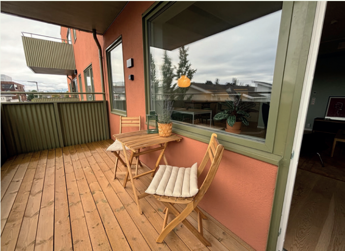
Balkong med rekkverk kledd med sinusplater.

på salget, på tross av et tøft boligmarked. Kjøperne er både par og folk som bor alene, med en miks av yrkesaktive og pensjonister, forteller Söder.