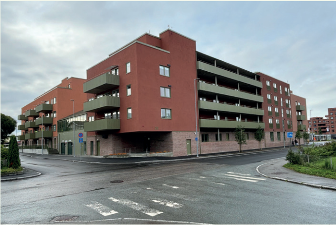
Signaturhagen i Stjørdal. Det lave bygget midt i hesteskoen hører ikke til prosjektet.